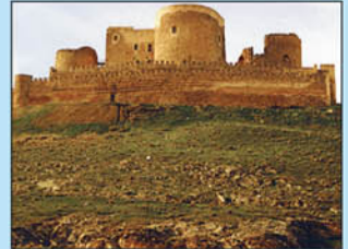
16. Castillo. Su origen se remonta a la etapa del califato de Córdoba. Fue cedido por Alfonso VIII a la Orden de San Juan de Jerusalén en el año 1183 convirtiéndose en sede de esta Orden. En el año 1813 fue destruido por las tropas napoleónicas. Actualmente se ha restaurado parte de la fortaleza, pudiendo visitar, la galería, los aljibes, las torres, este, oeste y sur, la nave de archivos, la sala capitular o la ermita.