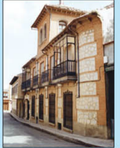
15. Casonas de la ciudad. Elementos que enriquecen el casco urbano de Consuegra. En su mayoría se corresponden a casa de labor manchegas. Destaca ante todo la forja en balcones y ventanas.