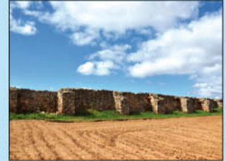
18. Presa Romana. A 4 Km. de la localidad en dirección hacia Urda. Con 638 metros de longitud es la mas larga que se conserva procedente del mundo romano. Su zona central está reforzada con 14 contrafuertes y consta de un aliviadero.