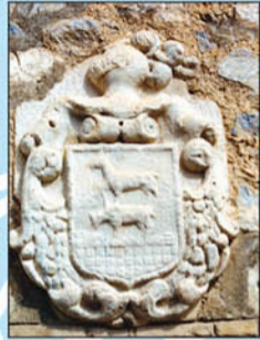
9. Escudo heráldico del apellido CERVANTES. Escudo ubicado en el lateral de la casa situada en la calle verdadera baja. Representa a dos ciervos. En el siglo XVI se tiene constancia de la existencia en Consuegra de familias con este apellido.