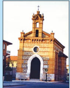
13. San Rafael. Construida en el popular barrio del "Imparcial", de estilo castellano-mudéjar, con su construcción culminó la reconstrucción de la ciudad tras la inundación del 11 de septiembre de 1891.

En la Mancha, (Al-Ansha: tierra seca o tierra sin agua), al no haber ríos que sirvieran como fuente de energía y donde el cereal prácticamente era un monocultivo, para transformar el trigo en harina se recurrió a la fuerza del viento. El funcionamiento es algo sencillo pero a la vez curioso. Una vez orientada la cúpula y puestas las aspas frente al viento se procede a cubrir éstas con telas o lonas. Las aspas transmiten el movimiento al eje y éste por medio de una serie de mecanismos de engranaje a dos piedras o muelas que trituraron el trigo formando la harina. Cabe señalar que se han recuperado doce de los trece molinos que en principio se ubicaron en la colina.