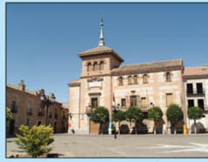
3. Edificio escolar "San Gumerindo". De fábrica castellano-mudéjar y arquitectura historicista, se construyó a principios del siglo XX.