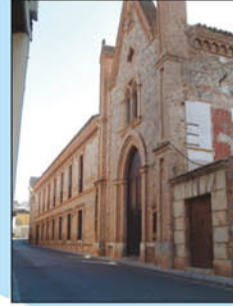
7. Madres de la Inmaculada Concepción. Edificio que muestra como singularidad la mezcla del gótico con el mudéjar, creando un conjunto diferente y armónico.