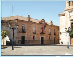
1. Ayuntamiento. Obra de 1670. Su fábrica de típico aparejo toledano con doble hilada de ladrillos y cajas de piedra. Destacan el arco y la torre del reloj, elementos añadidos con posterioridad.