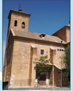
8. Iglesia de San Juan. Se construyó en 1567. De estructura longitudinal y planta en cruz latina de estilo castellano-mudéjar con torre dividida en cuatro cuerpos simétricos.