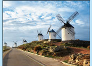
17. Molinos de Viento. Junto al castillo conforman la inconfundible silueta del cerro Calderico. Se conservan 12 de los 13 molinos. Entre ellos destacan los Molinos "Sancho", "Bolero", "Espartero" y "Rucio" al conservar el mecanismo completo.