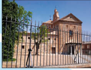
6. Santa María La Mayor. Obra de 1723. Iglesia de una sola nave de estilo castellano-mudéjar.