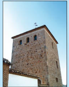
4. Palacio Prioral y Casa de la Tercia. Antigua casa de la Orden de San Juan en la Ciudad. Edificada sobre las termas romanas. Se componía de tres elementos, la iglesia, de la cual aún se conserva el ábside, la residencia y la torre.