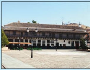
2. Corredores. Obra del siglo XVII uno de los edificios más destacados de la ciudad con balconada de madera y soportales descubiertos. En su interior se alberga el Museo Municipal con restos arqueológicos desde el neolítico hasta finales del siglo XIX.