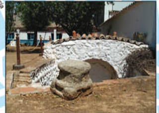
12. Alfar. Edificio de tradición popular. Fue utilizado como alfarería hasta mediados de la década de los 70. En su interior conserva dos hornos y restos de la época romana.