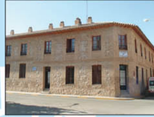
10. Centro de Salud. De arquitectura historicista. Fue construida a principios del siglo XX. Su primera función fue de centro educativo.