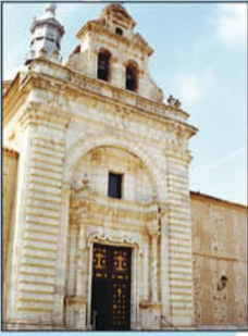
5. Iglesia del Santísimo Cristo de la Vera Cruz. Se inició en 1750 y se concluyó en 1803. Destaca su fachada, de mármol blanco. En el interior alberga un museo con exvotos y reliquias.