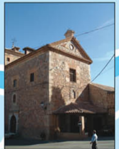
11. Convento de las Carmelitas. Fundado en 1517 en base al testamento de Don Fernando Álvarez de Toledo. Presenta una sola nave y potentes estribos de apoyo siendo la típica construcción carmelitana.